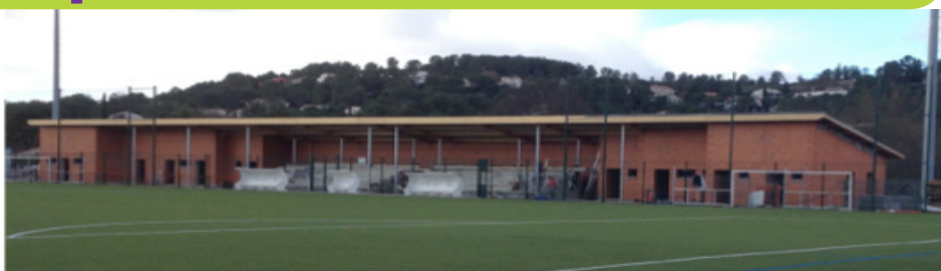
Grabels : vestiaires foot + tribunes 1,2 M€

Aux investissements très coûteux et sur dimensionnés